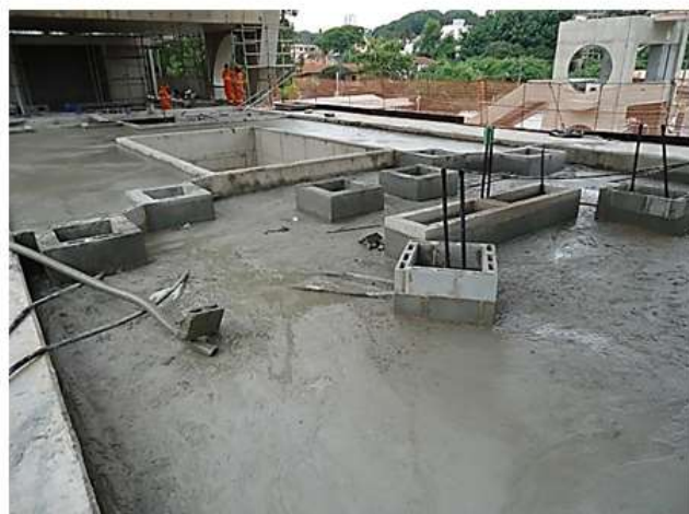
Vista do Mezanino.