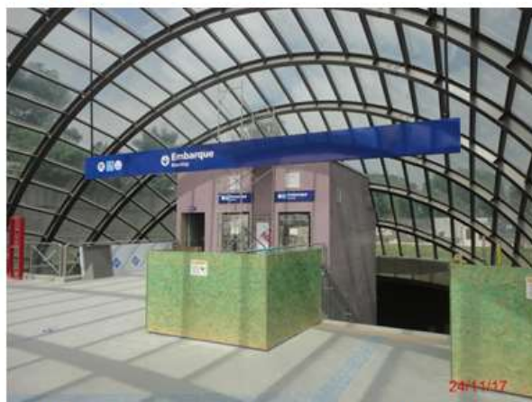
Acesso Principal: Concluído o acabamento