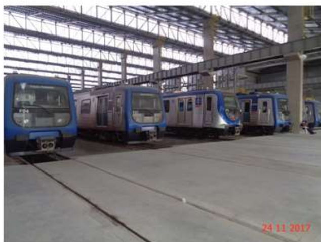
Trens da frota P e F estacionados no Bloco A do Pátio Guido Caloi.