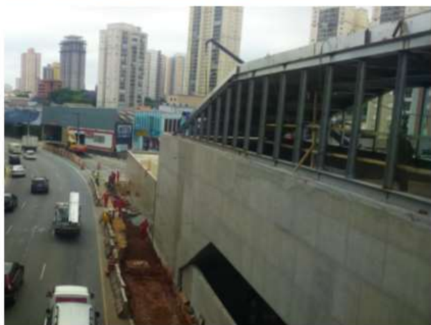
Regularização do entorno do Acesso Sul.