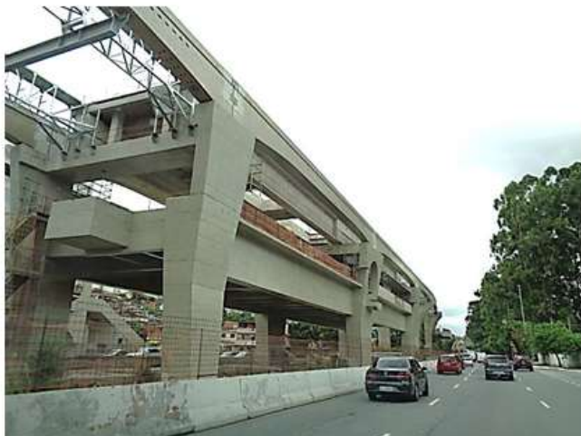
Vista do corpo da Estação.