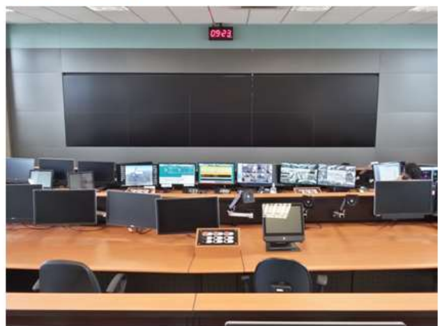
Bloco B: vista do CCO.