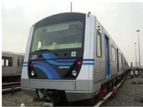
Linha 1 - Azul