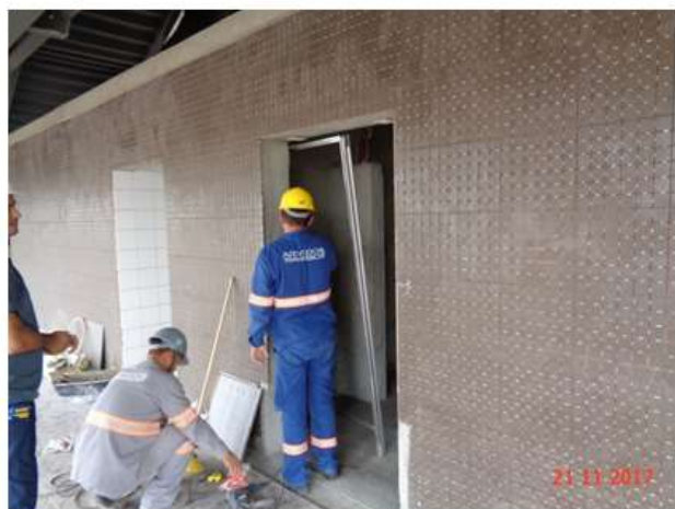
Execução do piso de granito do mezanino, revestimento cerâmico e pastilhas dos sanitários.