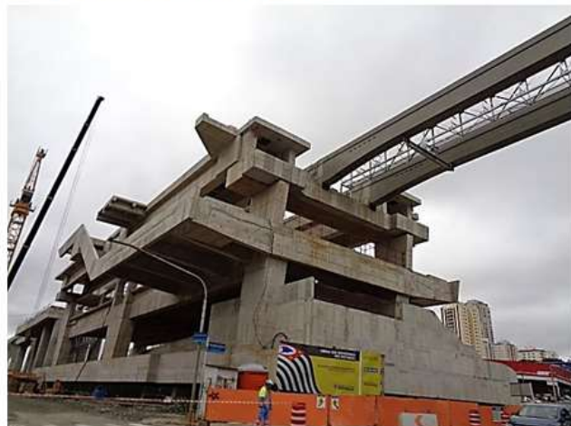
Corpo da Estação.