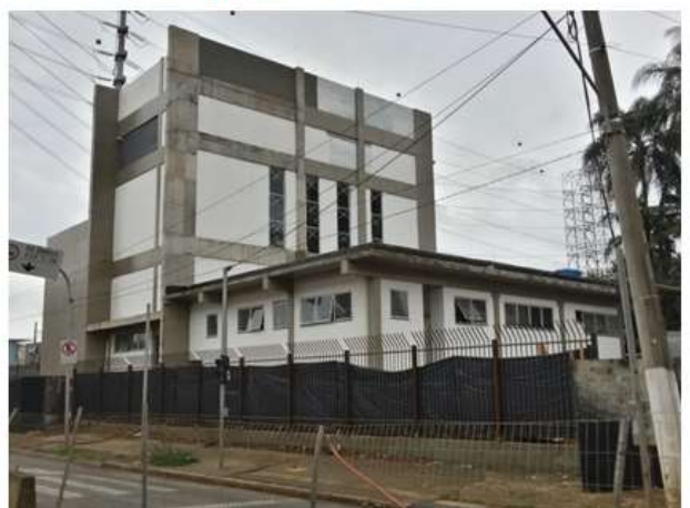
Execução do acabamento externo.