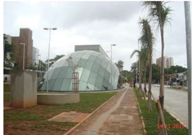
Acesso Principal Vista geral. Obra civil concluída