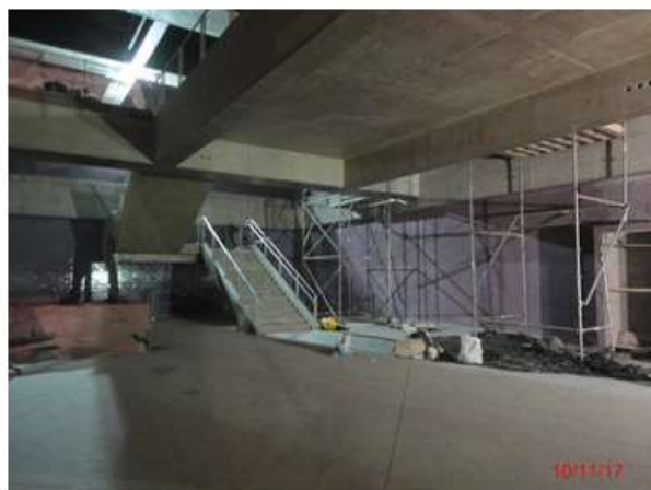
Corpo da estação: Concluído o acabamento nas plataformas