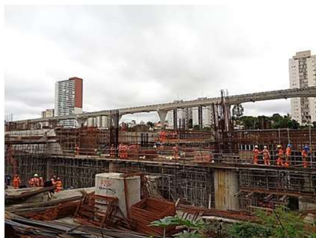
Execução de pilares e vigas.