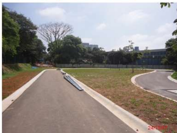
Parque das Bicicletas: Concluídos o paisagismo e a pavimentação