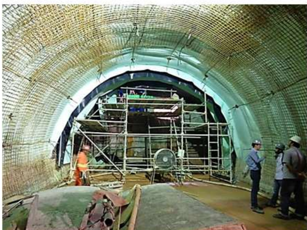
Execução do secundário do túnel de ligação ao Aeroporto.