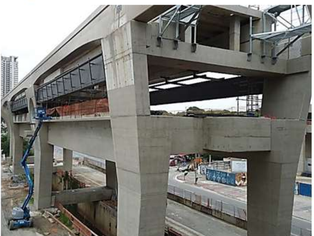
Corpo da Estação.