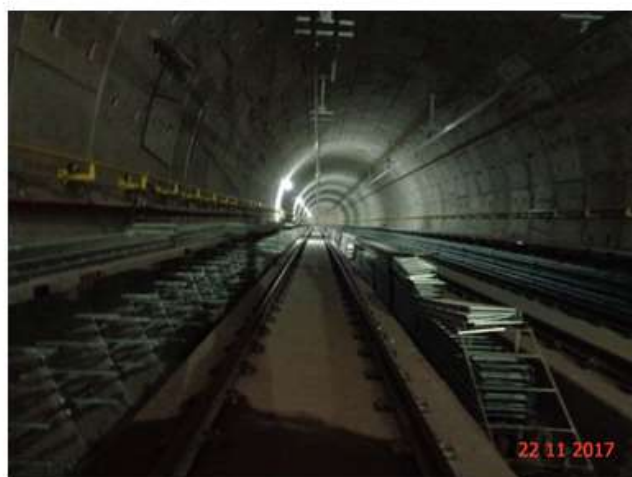
Trecho Eucaliptos - Moema: Instalados o bandejamento e a rede aérea