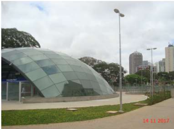
Acesso Principal: Vista geral. Obra civil concluída