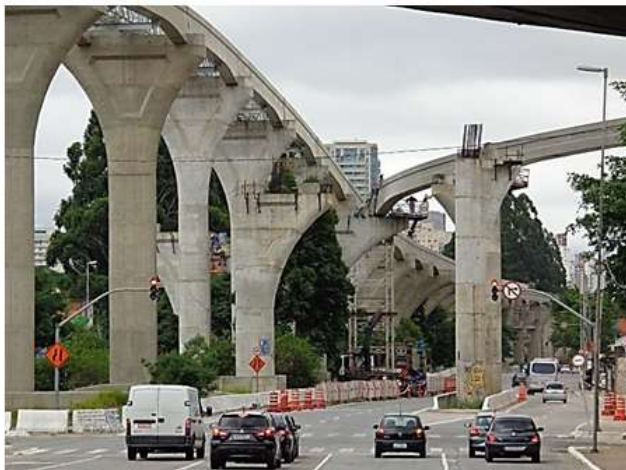
Lançamento de vigas guia curvas.