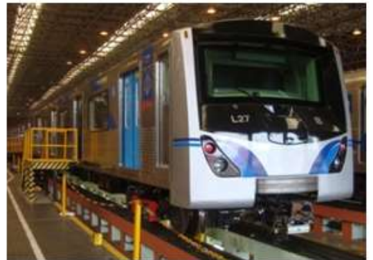
Linha 3 - Vermelha