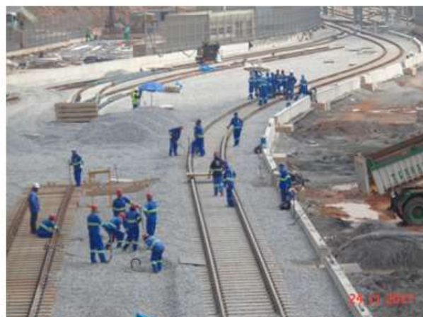
Via Permanente Fase II: Dormentes, trilhos e AMV's.