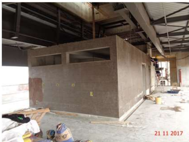
Execução do revestimento dos sanitários públicos do Mezanino.