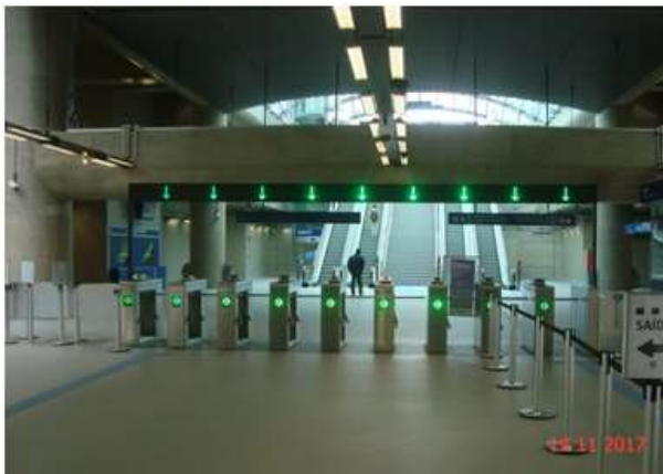
Mezanino: Vista geral. Obra civil concluída