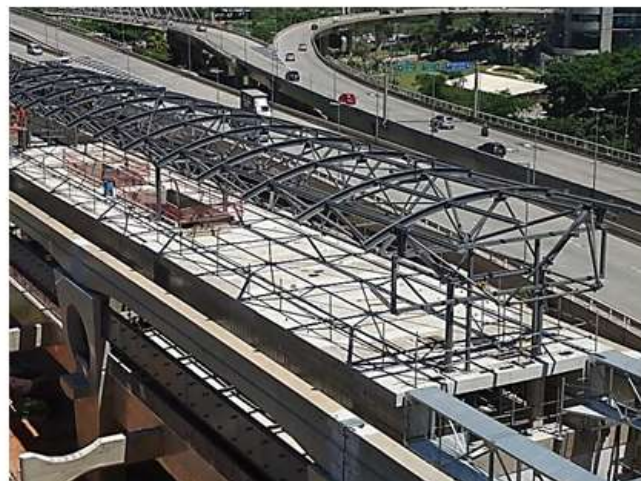
Instalação da cobertura metálica da Estação