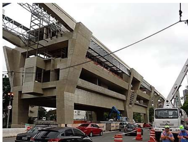
Instalação de estrutura metálica.