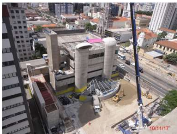
Vista aérea: Edifício das salas técnicas e acesso