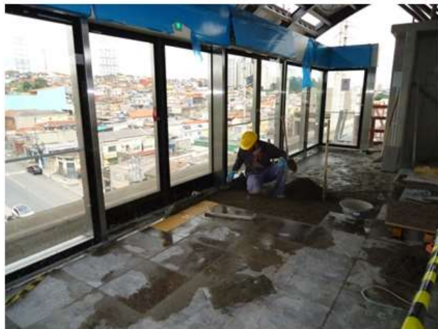
Assentamento do piso de granito na plataforma.