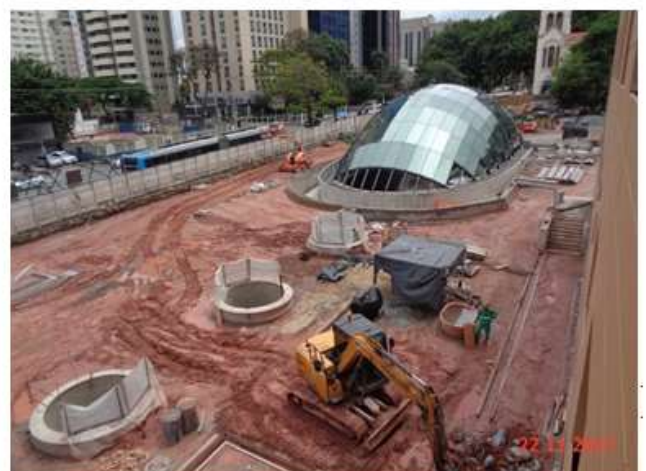
Cobertura: Reaterro e drenagem superficial