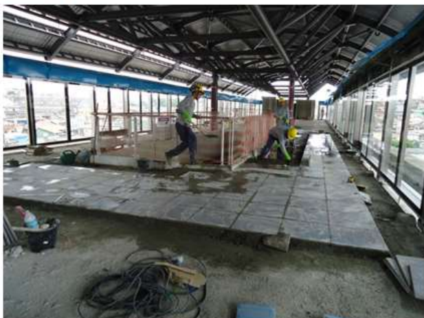
Assentamento do piso de granito na plataforma.