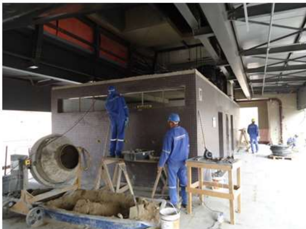
Assentamento das pastilhas nos sanitários públicos.