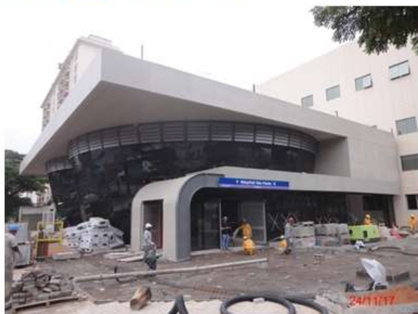
Acesso Sul: Urbanização