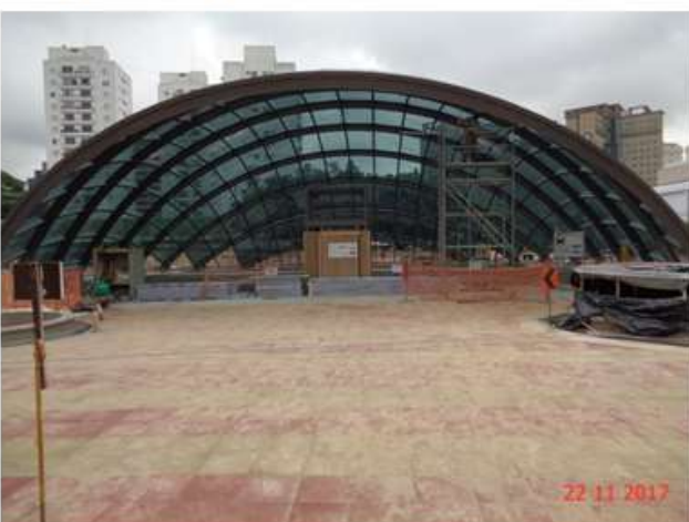
Acesso Principal: Assentamento do piso de concreto