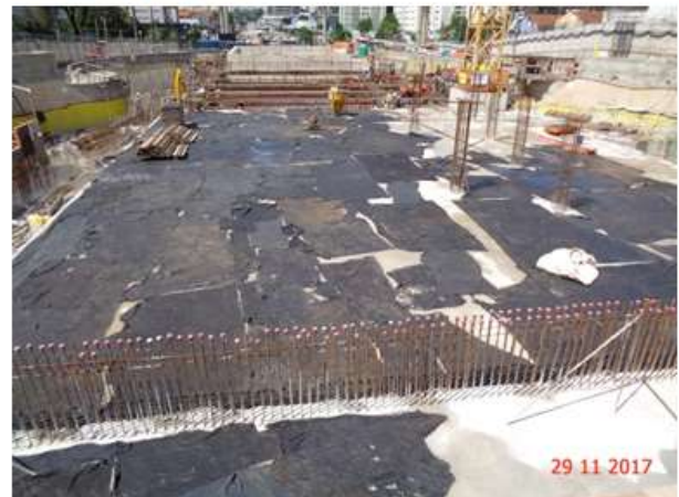
Corpo da estação – Poço 5: Laje do nível Cobertura