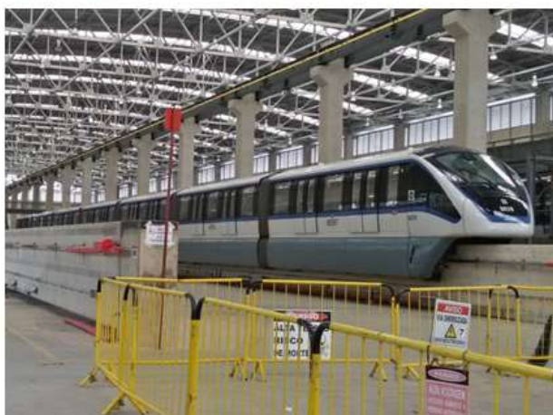
Trem em testes no Pátio Oratório.