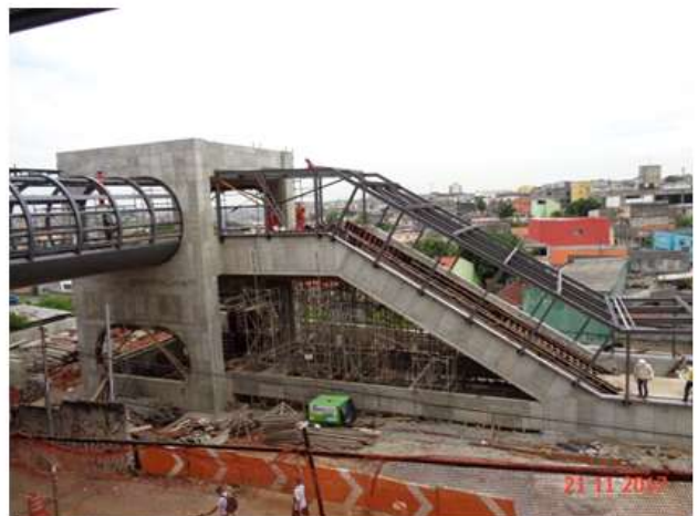
Execução da estrutura metálica das coberturas do Acesso Norte.