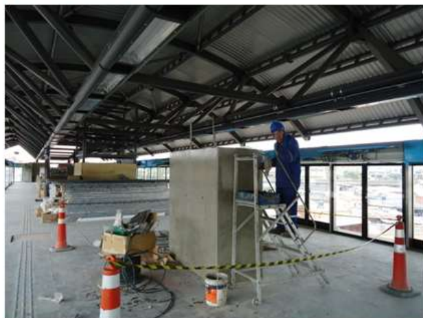
Tratamento do concreto dos módulos da plataforma.