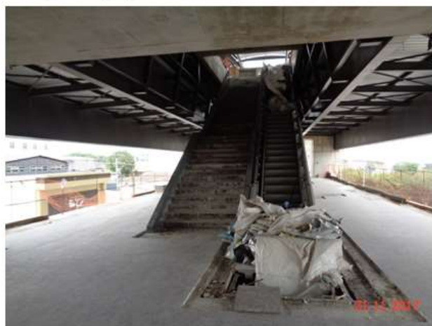
Execução do piso de granito do Mezanino.